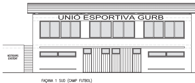
FAÇANA 1 SUD (CAMP FUTBOL)

A aquest Fons, que s'emmarca dins el pla de xoc del Govern Central per combatre l'actual crisi econòmica, hi tenen dret tots els municipis, i l'import que correspon a cadascun és en funció dels habitants.