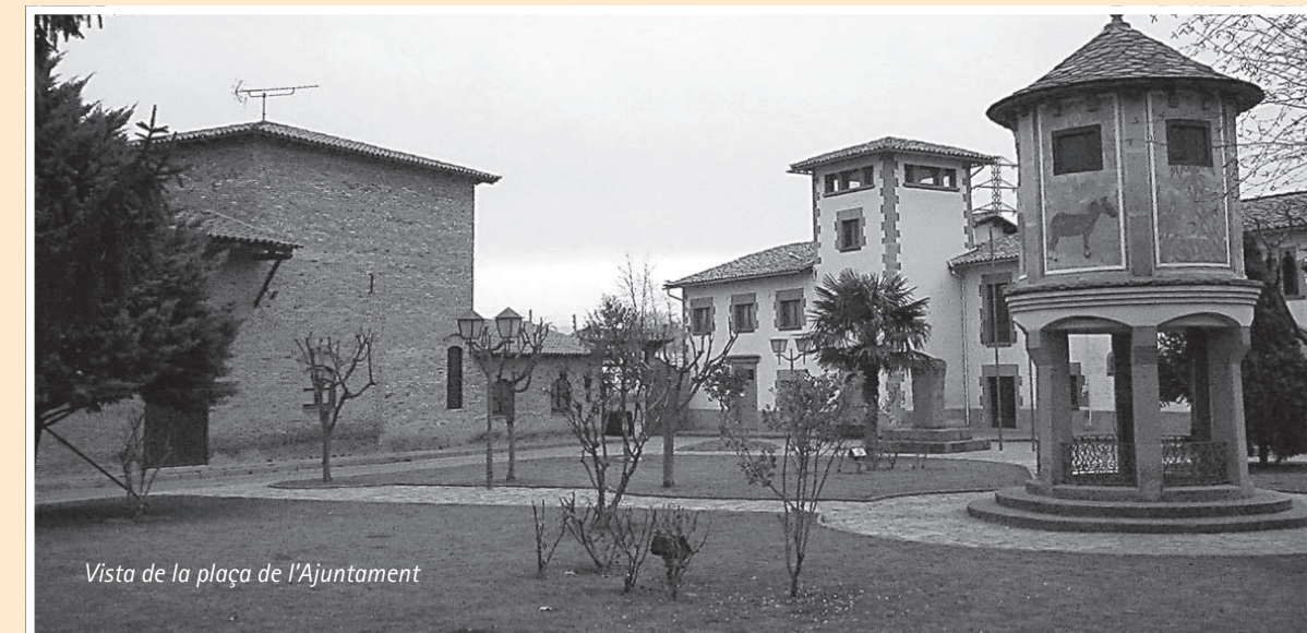
Vista de la plaça de l'Ajuntament

Així doncs, el pressupost de l'any 2000 destina el noranta per cent dels recursos a inversions en obres, dedicant la resta de la despesa, el 10 per cent, al manteniment de les instal·lacions, al personal i a la resta actuacions municipals.